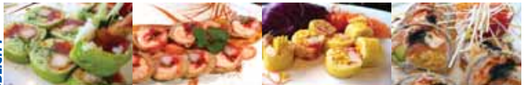
A. Rose Make #1 9,45 thon, crevettes tempura, feuille de soya, riz, sauce chef, avocat, concombre, massago A1. Miss Saigon 9,45 saumon, échalotte grillé, feuille de riz, massago, avocat B. Orange Mango 8,45 pétoncle, mangue, feuille de soya, riz, massago, sauce du chef Black Eye 9,95 Saumon fumé, saumon frais, fromage, avocat, légèrement panné,