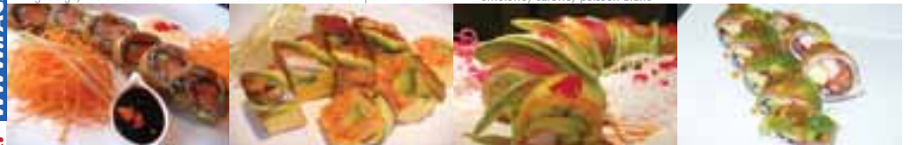
H. Dragon Eye 7,95 thon, saumon, carotte, échalotte, riz Geisha 9,95 Int.: tartare de crabe Ext.: Anguille, avocado, feuille de soya JADE 9,95 Ext.: Thon, saumon, avocat Int.: Avocat, concombre, goberge KANDA 8,95 Saumon, omelette, goberge, wakame