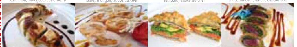
S. Yakuza 9,45 asperge, anguille, fromage à la crème, crevettes tempura, sauce, massago, sauce chef, ext. avocat SAMURAI 9,45 Feuille de riz, pétoncle, patate sucré Club Sushi 2 mcx (gros) 7, 95 Saumon fumé, oignon frit, laitue, échalotte, avocat, concombre, entre 2 noris THON DU CHEF 9,95 Thon, wakame, légèrement panné