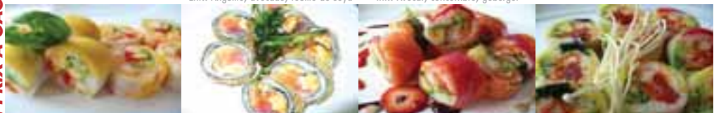
M. Aloha 9,45 crevettes, ananas, tempura, crevettes pannées, avocat, concombre, ext. mangue MOZZARELLA 9,95 Thon, saumon, mozzarella fromage, légèrement panné N. Shōtime Maki 1 9,45 crevettes pannée, avocat, concombre, ext. saumon, feuilles de riz N1. Shōtime Maki 3 9,45 saumon, thon, tobiko, avocat, concombre, ananas, goberge panné