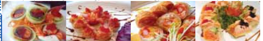
C. Sashimi Roll 8,95 thon, saumon, feuille d'algue, massago, goberge, roulé dans concombre F. Tartare de sushi 9,45 bloc de riz, mangue, sauce chef et choix: crevettes-thon-saumon-pétoncles-crabe G. Queen Mary 9,45 feuille de riz, riz, goberge, saumon, omelette, carotte, poisson blanc GRILL SALMON 9,95 Tartare de crabe, feuille de soya, avocat