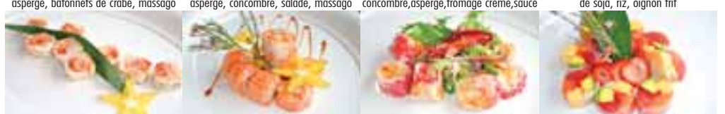
Pétoncle de luxe 8 mcx 9,45 Feuille de soya, garni tartare de pétoncle, tempura, goberge, avocat, tobiko La mer 8 mcx 9,95 Feuille de riz, saumon, échalotte, garni tartare aux crevettes, tempura Homard de luxe 8 mcx 9,50 Feuille de riz, homard panné, goberge, tobiko Rouleau santé 8 mcx 9,50 Feuille de riz, thon, saumon, tobiko, omelette, avocat, concombre, asperge blanche

WWW.FACEBOOK.COM/THEOPUBLICITY Photos: Présentations suggérées. Les prix sont sujets à changements sans préavis. Pour un temps limité. Taxes en sus. GAGNER! WWW.CITEMENU.COM (514) 368-9939 Les prix sont sujets à changements sans préavis. Pour un temps limité. Taxes en sus. AIMEZ CITEMENU SUR GAGNER GROS AVEC CITE MENU 10 000$ EN PRIX A GAGNER! Tous droits réservés. conception et impression par: www.citemenu.com