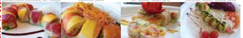
O. Shōtime Maki 2 9,45 crevettes pannées, avocat, concombre, ext. thon, mangue, feuille de riz P. Oméga 9,45 crevettes tempura enrobé de saumon fumé, mangue, sauce du chef Q. Maki de fruits 8,95 crevettes tempura, mélange de fruits, tempura, sauce du chef R. Homard 9,45 ext. avocat, int. homard, tobiko, sauce du chef, laitue, concombre